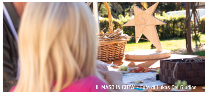
IL MASO IN CITTA'

Bei Regen findet die Veranstaltung nicht statt.