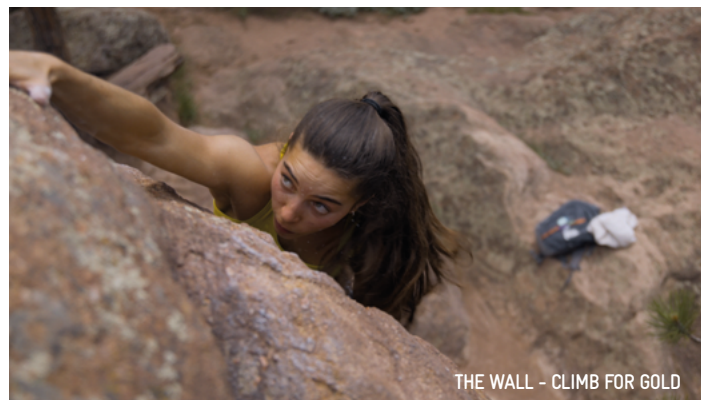
THE WALL - CLIMB FOR GOLD

Präsentiert von: Vertikale, AVS, FASI, IFSC In Zusammenarbeit mit: Filmclub Brixen.