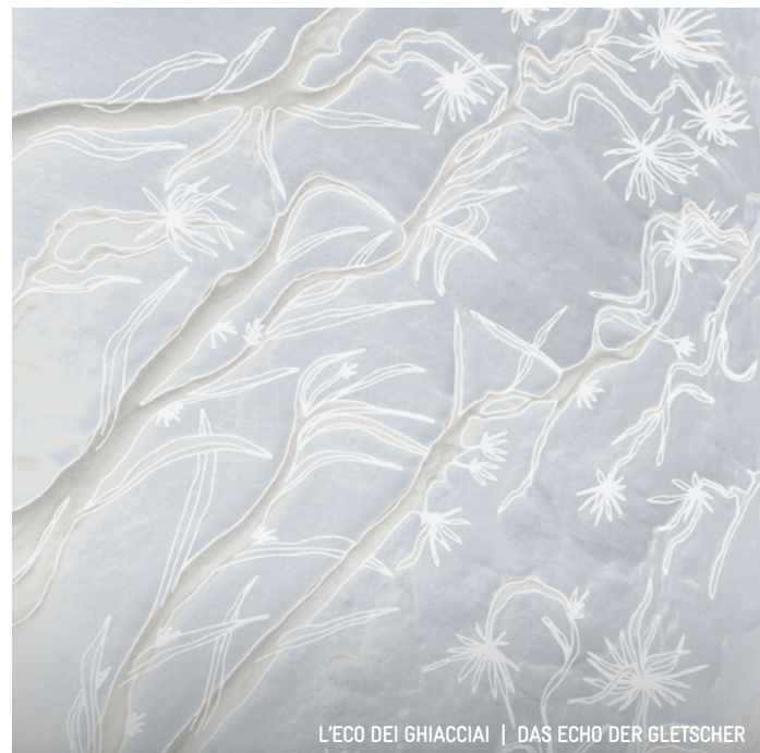
L'ECO DEI GHIACCIAI | DAS ECHO DER GLETSCHER

7. Juni: 17.30 – 19.00 Uhr von 8. bis 12. Juni: 10.00 – 12.00 Uhr 16.00 – 18.00 Uhr