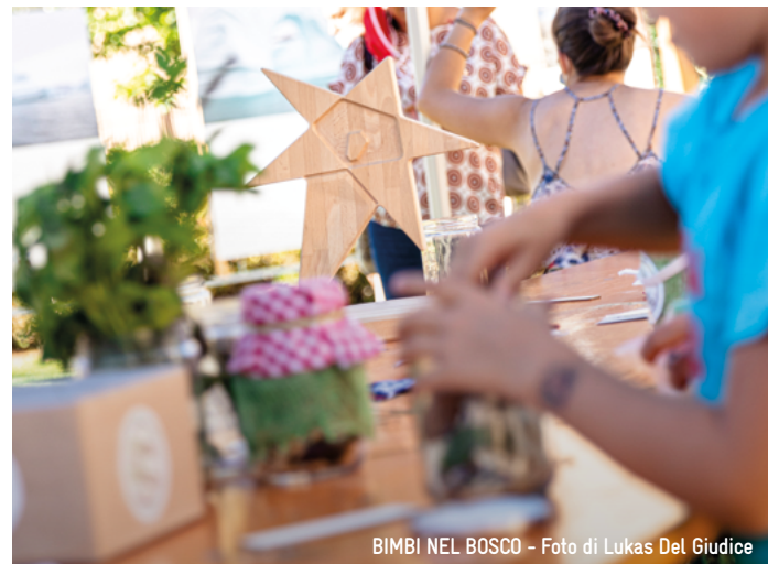
BIMBI NEL BOSCO